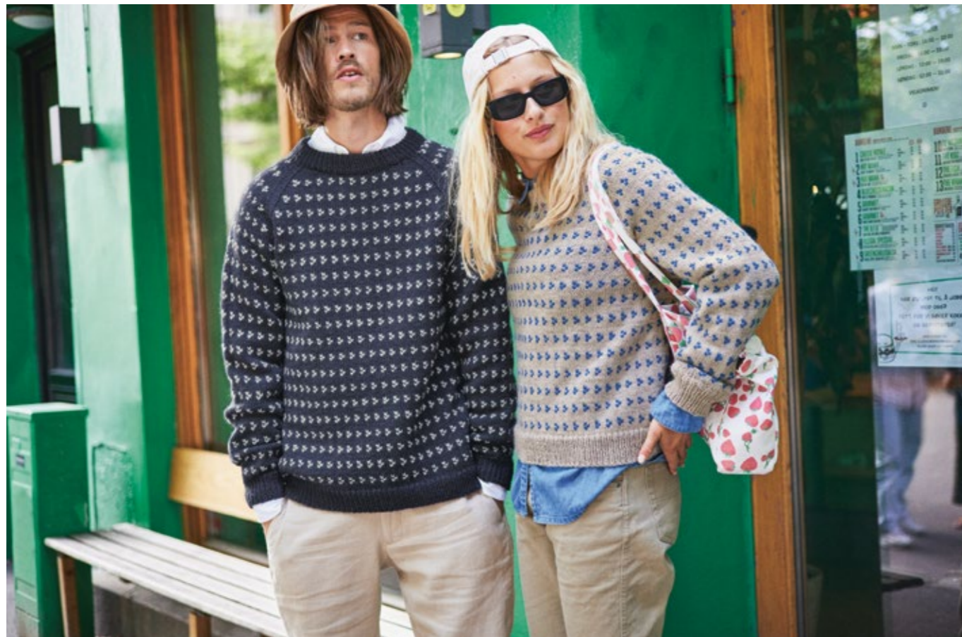
TEMA72 13 | PEERGYNT | ✕ 4 | \frac{\wedge\wedge\wedge}{20 | 10} | .....NORDSJØ HERREGENSER XS - 3XL (nedenfra og opp)