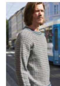
ISLENDERHERRE M/RAGLAN Sisu Design 6