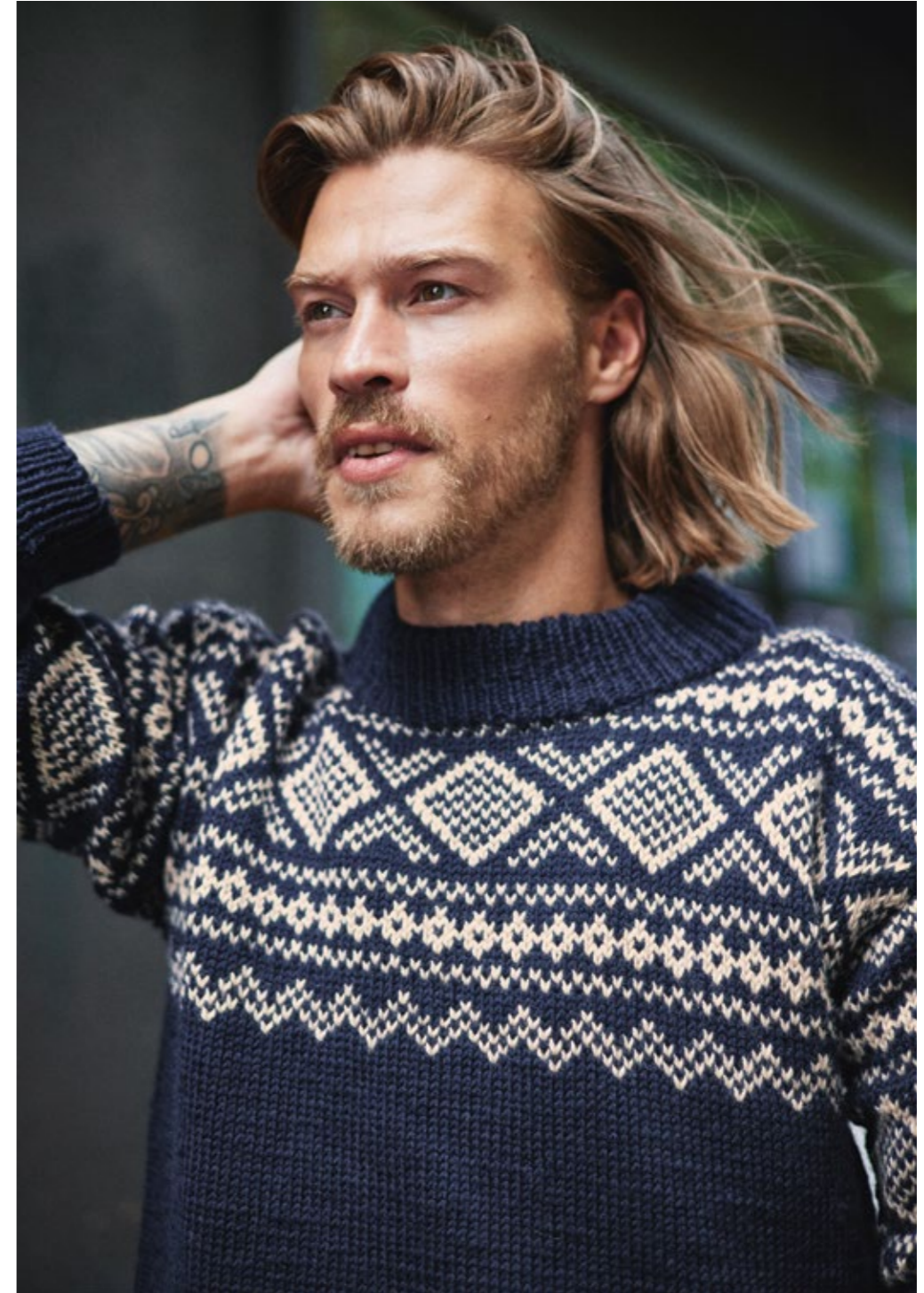
TEMA 72 | PEER GYNT | \times 4 | \frac{\wedge\wedge\wedge}{20 | 10} | \dots SLALOM HERREGENSER 11 | XS - 4XL (nedenfra og opp)