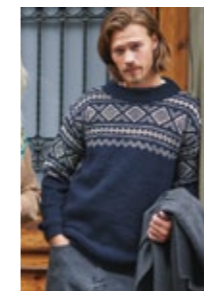
SLALOM HERREGENSER Peer Gynt Design 11