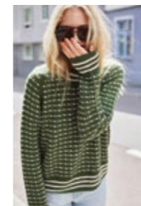
ISLENDERDAME M/RAGLAN Sisu Design 7