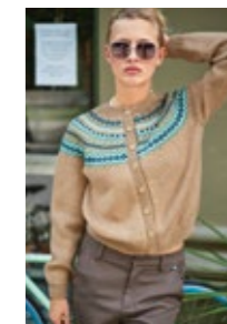
ANNADAMEKOFTE Alpakka Ull Design 10