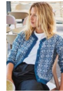
MYRDALSKOFTE Sisu Design 1