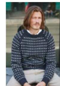
NORDSJØGENSER Peer Gynt Design 13