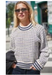
ISLENDERDAME Sisu Design 4