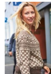
BØVERTUN DAMEKOFTE Alpakka Design 12