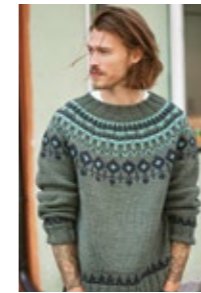
GRYNETHERREGENSER Fritidsgarn Design 2