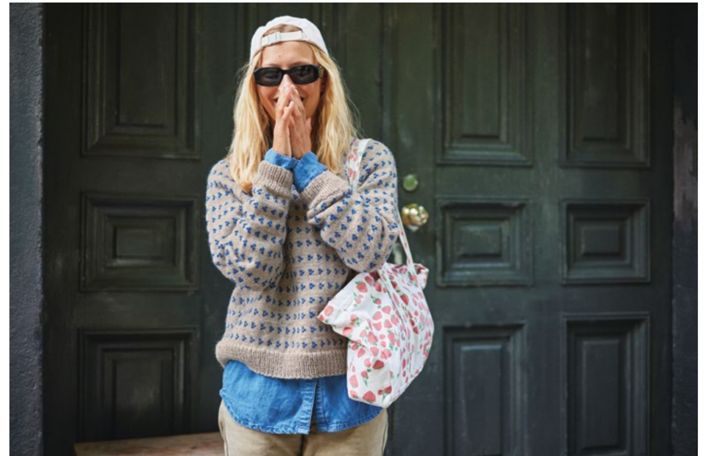
TEMA72 14 | PEERGYNT | ✕ 4 | \frac{\wedge\wedge\wedge}{20 | 10} | .....NORDSJØ DAMEGENSER XS - 3XL (nedenfra og opp)