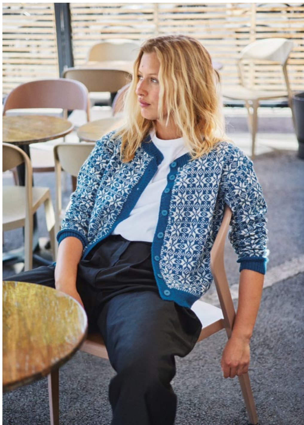
TEMA 72 | SISU | 3 | 27 | 10 | MYRDALSKOFTE DAME 1 | XS - 4XL (nedenfra og opp)