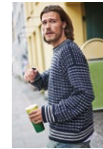
ISLENDERHERRE Sisu Design 5