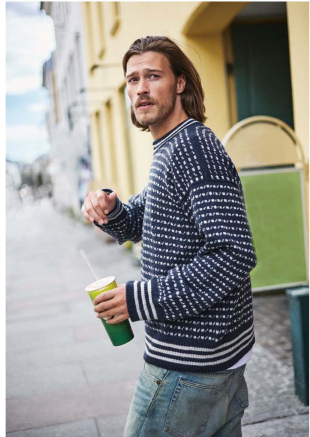
TEMA 72 | SISU | 3 | 27 | 10 | ISLENDER HERREGENSER XS - 5XL (ovenfra og ned)