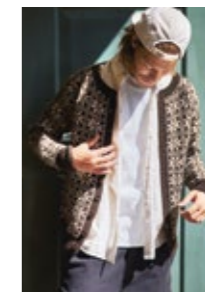
MYRDALSKOFTE HERRE Peer Gynt Design 9