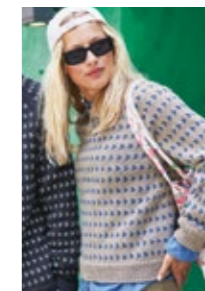
NORDSJØGENSER Peer Gynt Design 14

EVENTUELLE RETTELSE TIL DETTE HEFTET FINNER DU PÅ SANDNESGARN.NO