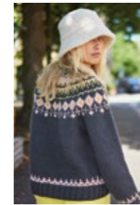
GRYNETDAMEGENSER Fritidsgarn Design 3