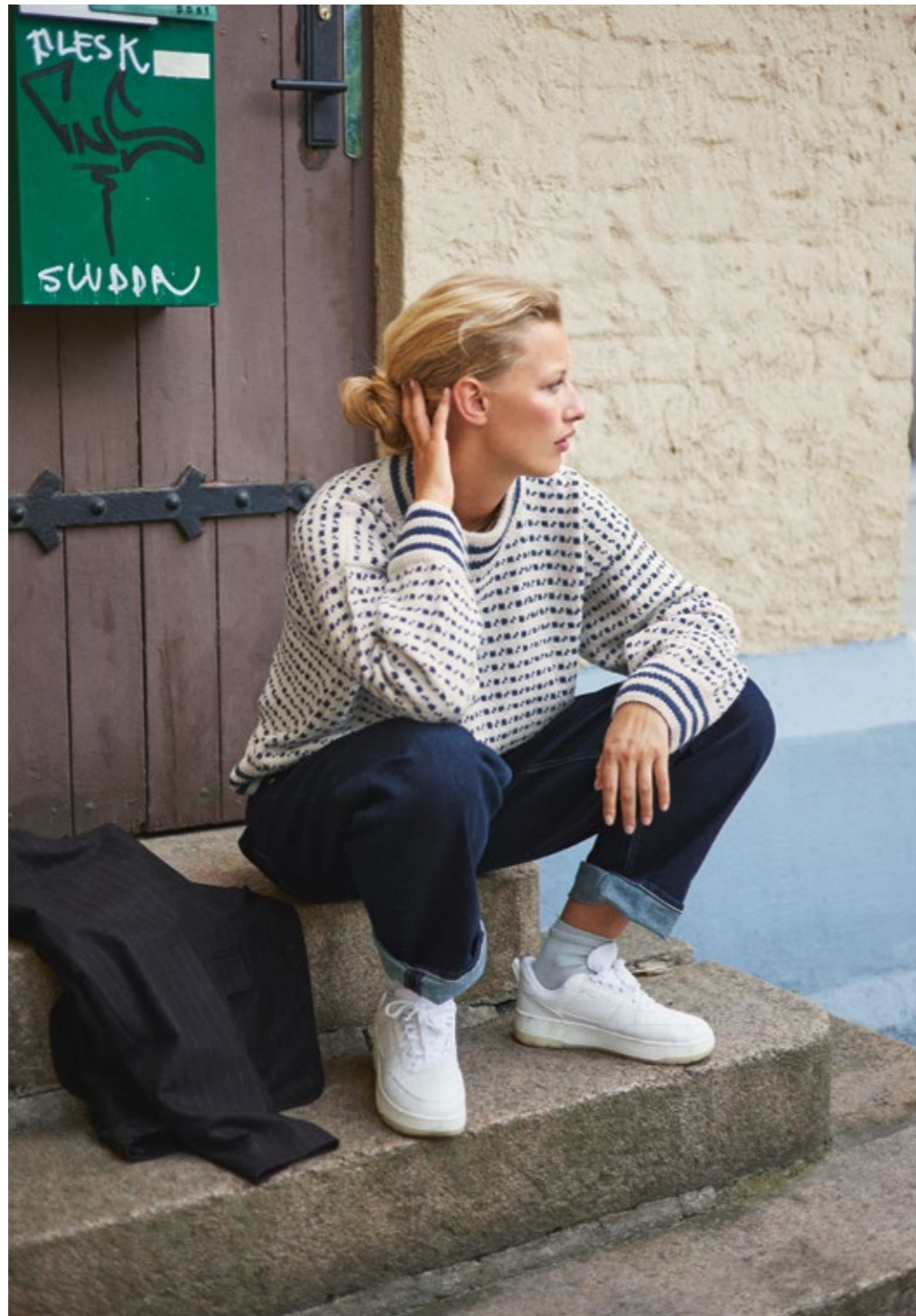
TEMA 72 | SISU | 3 | 27 | 10 | ISLENDER DAMEGENSER XS - 5XL (ovenfra og ned)