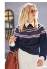
ANNAGENSER Peer Gynt Design 8