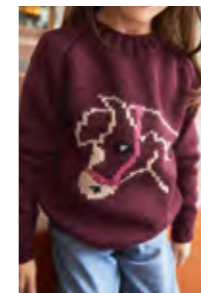
PONNY GENSER Smart Design 9