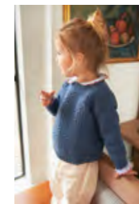
OLEGENSER Merinoull Design 7