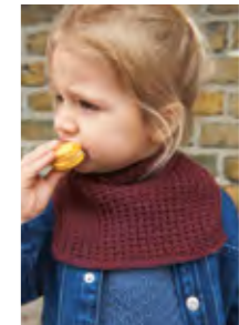
LUNA PERLERIBB- HALS Merinoull Design 4