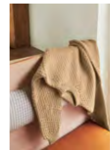
OLEGENSER Smart Design 7