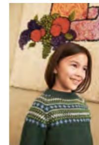
KRISGENSER Merinoull Design 8