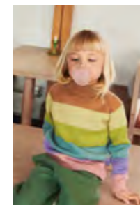
STINUS STRIPEGENSER Merinoull Design 5