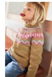
STORM GENSER Smart Design 6