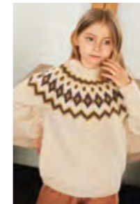
STORMGENSER Smart Design 1