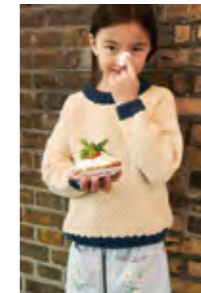
ANGUSGENSER Smart Design 3