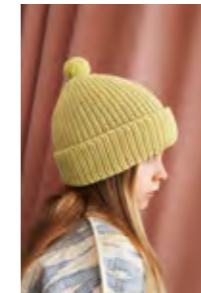
LUNARIBBLUE Merinoull Design 2