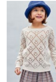
LANA GENSER Tynn Line Design 2