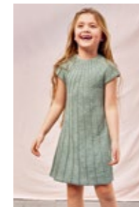
MOSEKJOLE Tynn Line Design 4