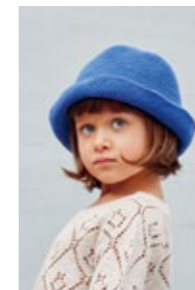
SARAS BØTTEHATT Mandarin Petit Design 7