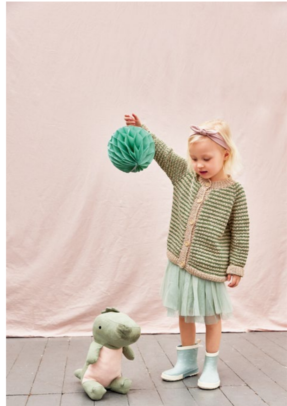
2206 | LINE | X 4 | 20 | 10 | ...RIDLEY JAKKE 1-12 ÅR (ovenfra og ned)