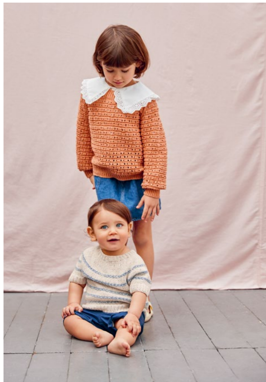
2206 | LINE | 4 | 20 | 110 | RIVER TOPP | 1-12 ÅR (nedenfra og opp)