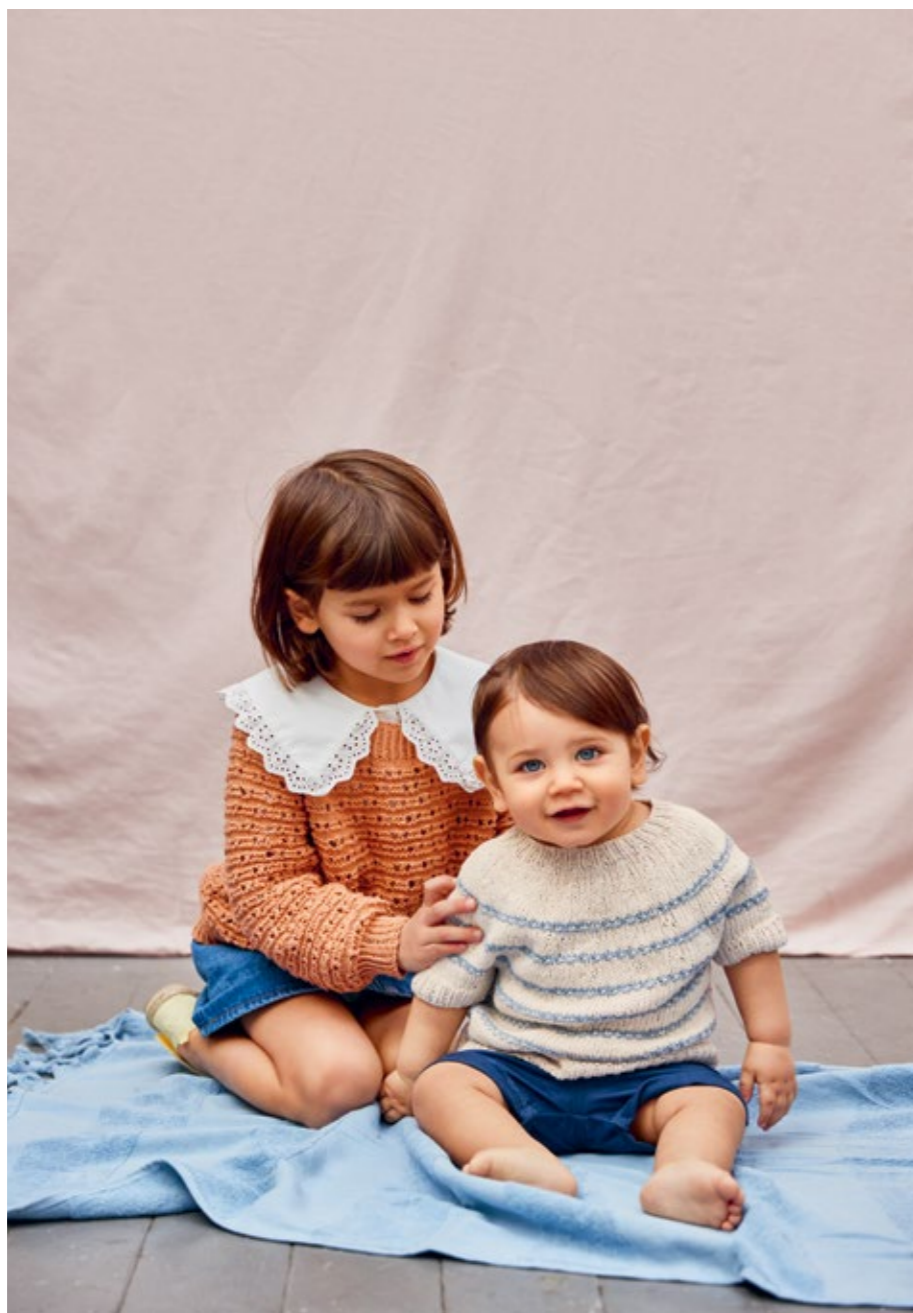
JUNE GENSER FINNER DU | 2205 BOMULL BARN