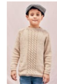
SKIPPER GENSER Mandarin Petit Tynn Line Design 5