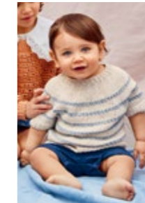
RIVER TOPP Line Design 3