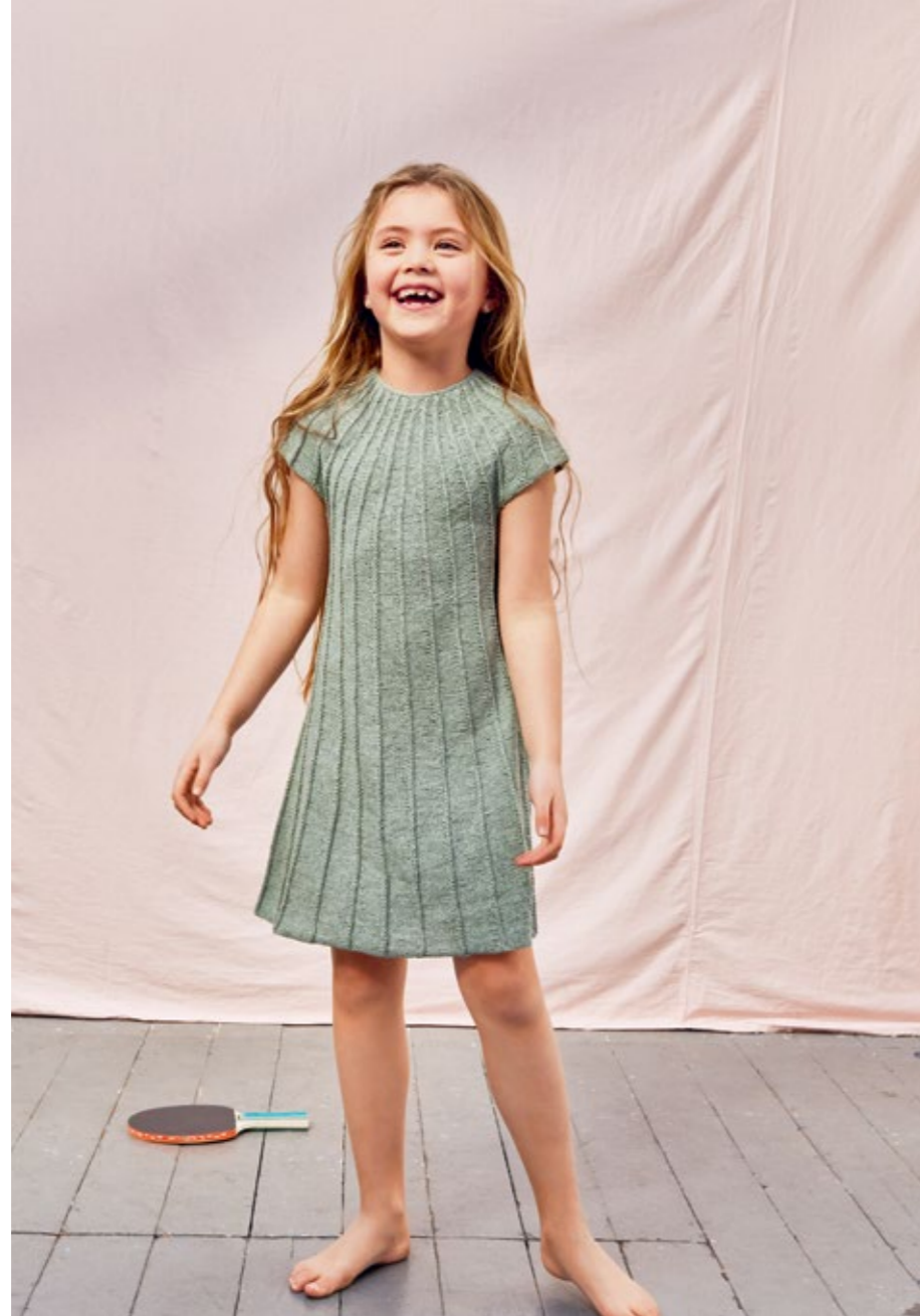
2206 | TYNNLINE | \times 2½ | \frac{7}{27} | MOSEKJOLE 4 | 27 | 10 | 1-12 ÅR (ovenfra og ned)