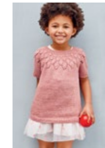
KONGLE TOPP Line Design 6